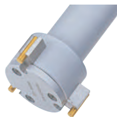
Měřicí plochy s titan. povlakem pro vyšší životnost