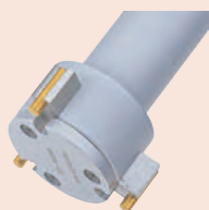
Měřicí plochy s titanovým povlakem pro zvýšení životnosti