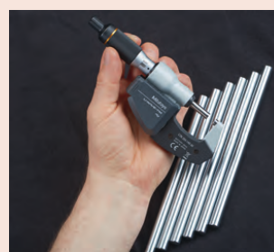
S bezdrátovým systémem U-WAVE fit