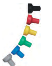
Barevné krytky (volitelné příslušenství)