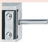
Provedení s kulatým hloubkoměrem