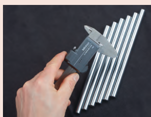
Posuvné měřítko s bezdrátovým systémem přenosu dat U-WAVE fit