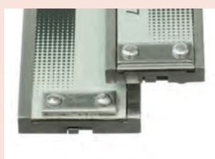
Vedení 150 a 200 mm nebo 300 mm