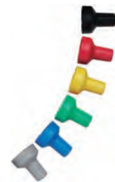
Barevné krytky (volitelné příslušenství)