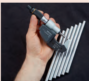
S bezdrátovým systémem U-WAVE fit