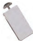
Obj. č. 950750